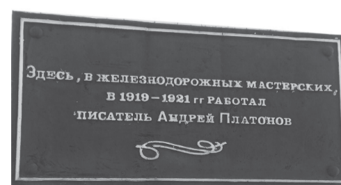
Табличка установлена на здании проходной Воронежского ТРЗ

На предприятии, где когда-то работал Климентов-старший, сегодня ремонтируют современные тепловозы. История завода, основан-